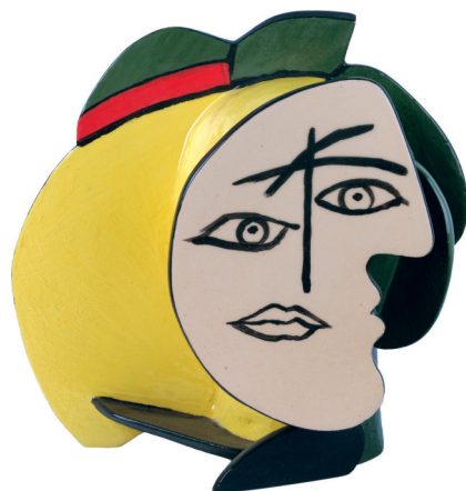
ЖЕНА 2 керамика – енгоба/глазура 2015, 40 x 16 x 36.5 cm WOMAN 2 Ceramics – engobe/glaze 2015, 40 x 16 x 36.5 cm