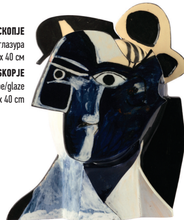
ЖЕНАТА ОД СКОПЈЕ керамика – енгоба/глазура 2015, 33 x 16 x 40 cm THE WOMAN FROM SKOPJE Ceramics – engobe/glaze 2015, 33 x 16 x 40 cm