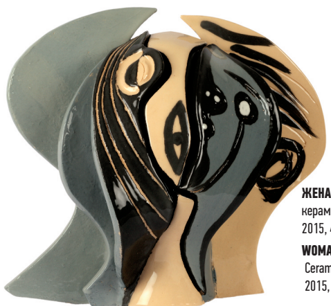
ЖЕНА 1 керамика – енгоба/глазура 2015, 40 x 16 x 36.5 cm WOMAN 1 Ceramics – engobe/glaze 2015, 40 x 16 x 36.5 cm