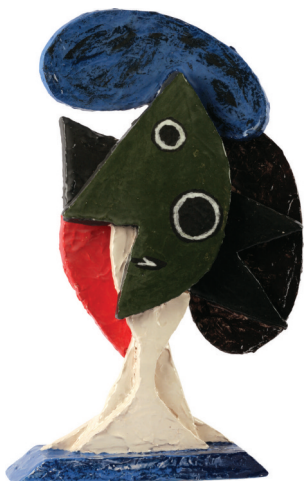
ЖЕНА РИБА керамика – енгоба/глазура 2016, 29 x 9 x 44.5 cm FISH WOMAN Ceramics – engobe/glaze 2016, 29 x 9 x 44.5 cm