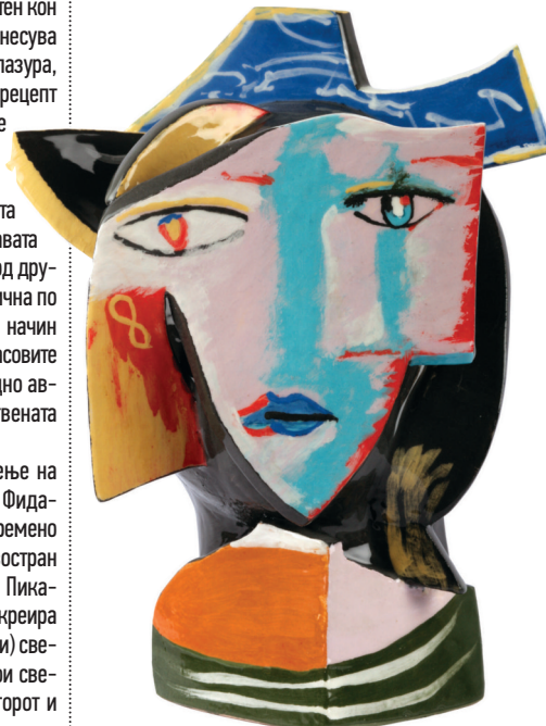
ЖЕНА 4 , керамика — енгоба/глазура 2015, 28,5 x 16,5 x 36 см WOMAN 4 , Ceramics — engobe/glaze, 2015, 28.5 x 16.5 x 36 cm