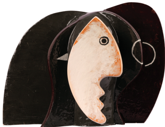
ЖЕНА 5 керамика – енгоба/глазура 2016, 50 x 16 x 35 cm WOMAN 5 Ceramics – engobe/glaze 2016, 50 x 16 x 35 cm