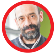
Автор Тони Димков