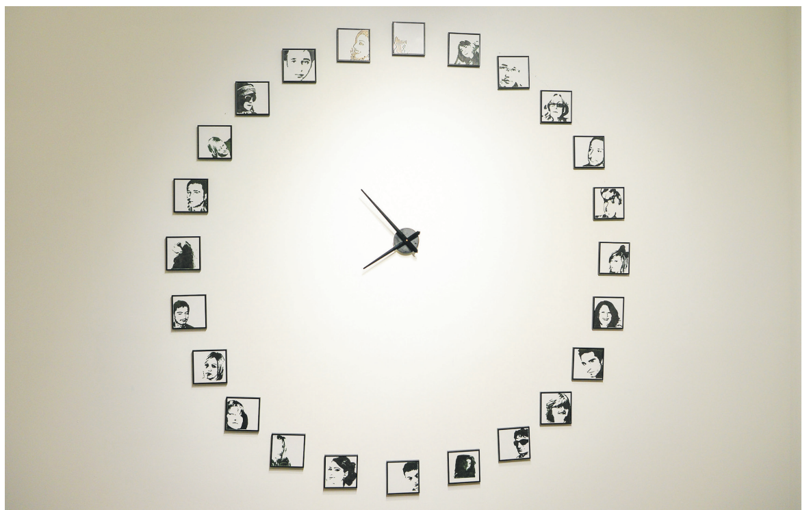
↑ „Време за...“ (2010)